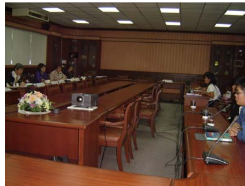
คณะกรรมการฯ สัมภาษณ์นิสิตปริญญาโทและเอก วันที่ 1 ธันวาคม 2548