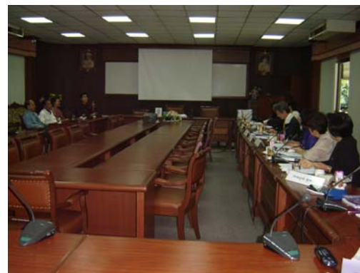
คณะกรรมการฯ สัมภาษณ์ผู้แทนอาจารย์ คณะศึกษาศาสตร์ วันที่ 1 ธันวาคม 2548