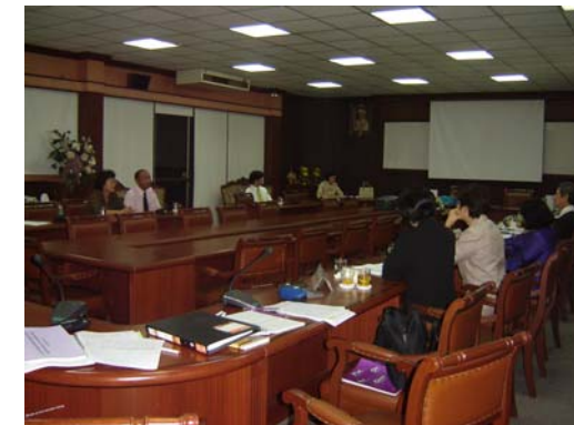
คณะกรรมการฯ สัมภาษณ์ผู้ใช้บัณฑิต และศิษย์เก่า วันที่ 1 ธันวาคม 2548