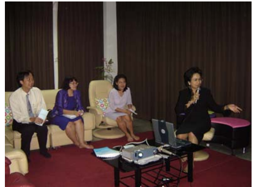
คณะกรรมการฯ เชื่อมชมศูนย์การศึกษาเชิงบูรณาการ วันที่ 1 ธันวาคม 2548