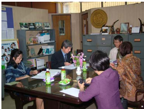
คณะกรรมการฯ เชื่อมชมภาควิชาเทคโนโลยีการศึกษา วันที่ 30 พฤศจิกายน 2548