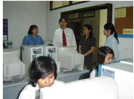
คณะกรรมการฯ เยี่ยมชมศูนย์คอมพิวเตอร์เพื่อการศึกษา วันที่ 30 พฤศจิกายน 2548