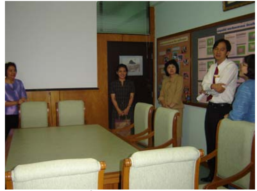
คณะกรรมการฯ เยี่ยมชมศูนย์จัดการคุณภาพการศึกษา วันที่ 30 พฤศจิกายน 2548