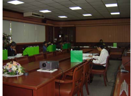
คณะกรรมการฯ ตรวจสอบเอกสารหลักฐาน วันที่ 30 พฤศจิกายน 2548