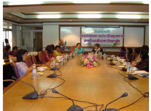
คณะกรรมการฯ เชื่อมชมโรงเรียนสาธิตแห่ง มก. วันที่ 1 ธันวาคม 2548