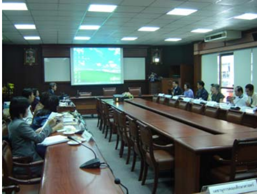
คณะกรรมการฯ พบผู้บริหารคณะศึกษาศาสตร์ วันที่ 30 พฤศจิกายน 2548

คณะศึกษาศาสตร์ ระหว่างวันที่ 30 พฤศจิกายน – 2 ธันวาคม พ.ศ. 2548