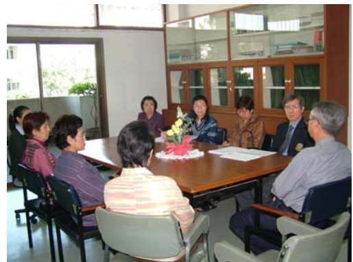
คณะกรรมการฯ เชื่อมชมภาควิชาจิตวิทยาการศึกษาฯ วันที่ 30 พฤศจิกายน 2548