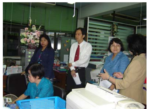
คณะกรรมการฯ เชื่อมชมสำนักงานเลขานุการคณะฯ วันที่ 30 พฤศจิกายน 2548