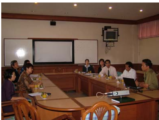
คณะกรรมการฯ เชื่อมชมภาควิชาพลศึกษา วันที่ 30 พฤศจิกายน 2548