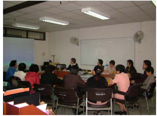
คณะกรรมการฯ เชื่อมชมภาควิชาการศึกษา วันที่ 1 ธันวาคม 2548