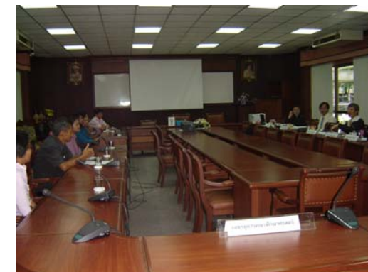
คณะกรรมการฯ สัมภาษณ์บุคลากร คณะศึกษาศาสตร์ วันที่ 1 ธันวาคม 2548