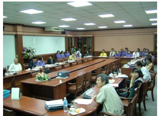
คณะกรรมการฯ รายงานผลการประเมินฯ ให้ผู้บริหาร บุคลากรของคณะฯ รับทราบวันที่ 2 ธันวาคม 2548