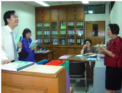
คณะกรรมการฯ เชื่อมชมศูนย์บัณฑิตศึกษา ภาคพิเศษ วันที่ 1 ธันวาคม 2548