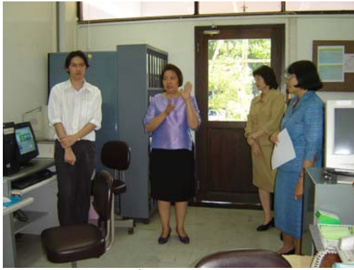
คณะกรรมการฯ เยี่ยมชมหน่วยบริการสารสนเทศ วันที่ 30 พฤศจิกายน 2548