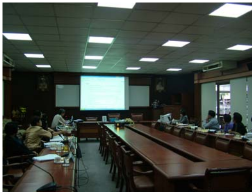
คณะกรรมการฯ พบคณะกรรมการจัดการคุณภาพการศึกษาของคณะฯ วันที่ 2 ธันวาคม 2548