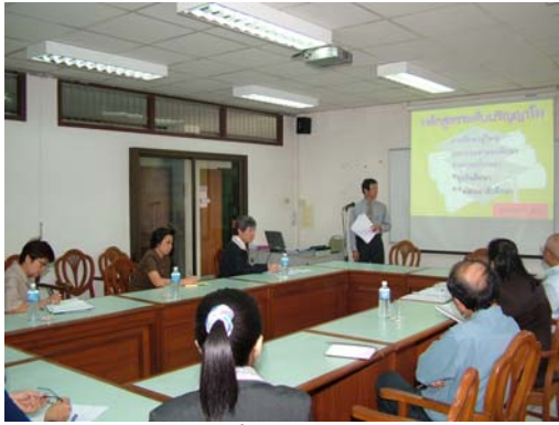
คณะกรรมการฯ เชื่อมชมภาควิชาอาชีวศึกษา วันที่ 1 ธันวาคม 2548