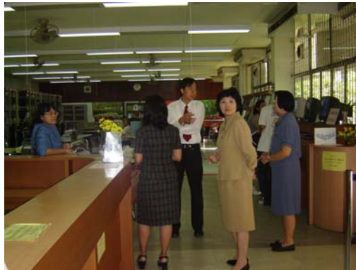
คณะกรรมการฯ เยี่ยมชมห้องสมุดคณะฯ วันที่ 30 พฤศจิกายน 2548