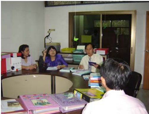
คณะกรรมการฯ เชื่อมชมศูนย์ปฏิบัติการฝึกประสบการณ์ วิชาชีพศึกษาศาสตร์ วันที่ 1 ธันวาคม 2548